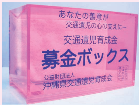
募金箱サイズ：縦10cm、横20cm、高さ13cm