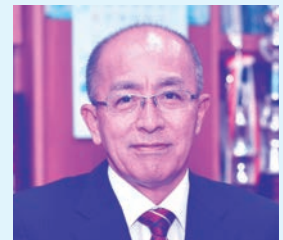
富里一公副理事長