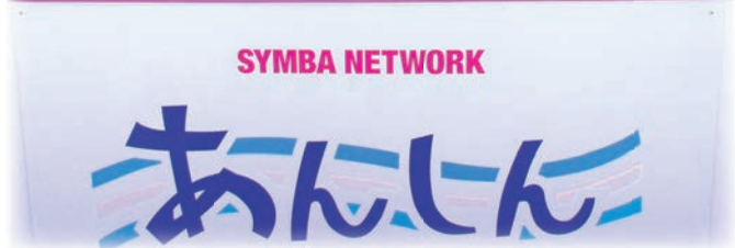
募金ボックス10個を設置した 株式会社あんしんの社員ら＝9月29日、浦添市西洲