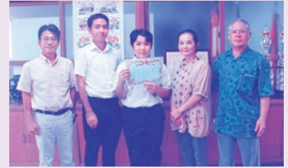
★ 西原東中学校 ★

メッセージを受け取った生徒は「図工が得意なので頑張りたい」と話し、親泊校長は「コロナ禍の中、リモート授業などあり大変だったが、生徒たちはよく我慢し、頑張っている」と語っていました。