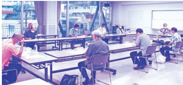
令和3年度の定時評議員会

発行 公益財団法人 沖縄県交通遺児育成会 〒900-0027 沖縄県那覇市山下町18番26号 山下市街地住宅2階B-211号室 電話 (098) 987-0743 FAX (098) 987-0744 http://okiko-iku.com