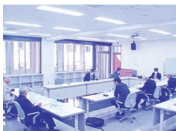
令和2年度第3回理事会

事業計画では令和3年 度も①奨学金等給付事業 ②人材健全育成事業③募 金・寄付金受け入れ事業 広報活動事業の3本柱で 活動することを承認しま した。また、今年7月に 設立50年を迎えることか ら、「設立50周年記念誌」 発行を決めました。 予算では職員の退職金 引当金への積立を行うこ とを承認しました。