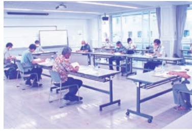
令和3年度第1回理事会

令和3年度第1回理事 会が5月26日、那覇市首 里石嶺町の県総合福祉セ ンターで開催され、令和